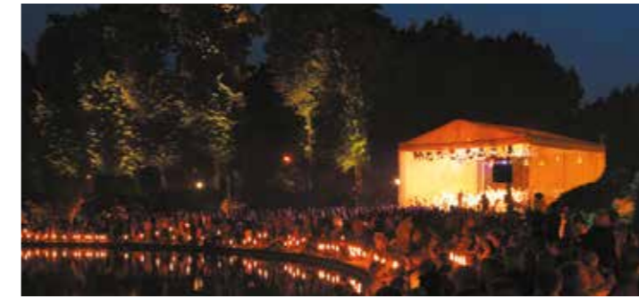
Mitte September eines jeden Jahres: „Musik und Licht am Hollersee“

Der Deutsche Preis für Denkmalschutz, mit dem der Bremer Bürgerparkverein 1991 ausgezeichnet wurde, zeigt, welch hohen Stellenwert dieses Engagement auch heute noch für den Park hat.