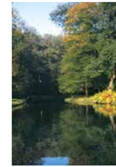
Partie im Bürgerpark