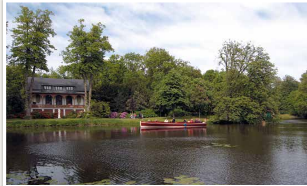
Die MARIE vor der Meierei-Villa