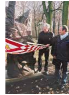
Enthüllung des Spenderdenkmals als Dank für alle Spender

Diese bremisch-hanseatische Tradition ist - betrachtet man die Geschichte des Bremer Bürgerparks - deutlich spürbar. Viele Bremer fühlen sich seit Generationen mit ihrem Park verbunden und unterstützen ihn nach Kräften. Davon zeugen die Namen auf den vielen gestifteten Brücken, Bänken und Denkmälern.