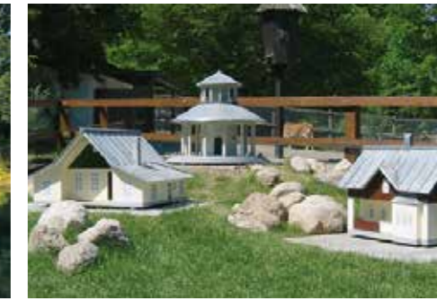
Meerschweinchenhof im Tiergehege