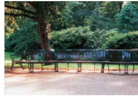
Früßmersbank von 1907